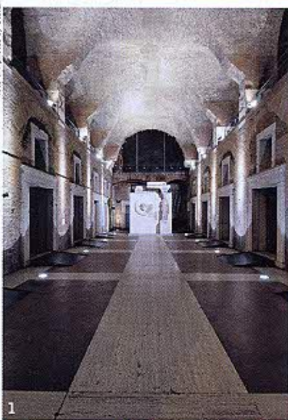
Torino, Palazzo Bertalzone di San Fermo (2) 5-11 / 31-01-2012