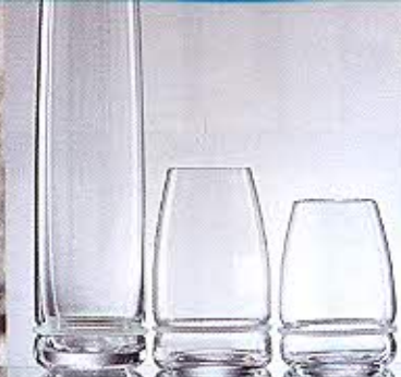
A. Castiglioni, Ovio (Danese, 1983)