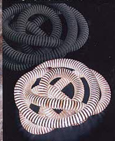
Frattini-Castiglioni, Boalum (Artemide, 1970)