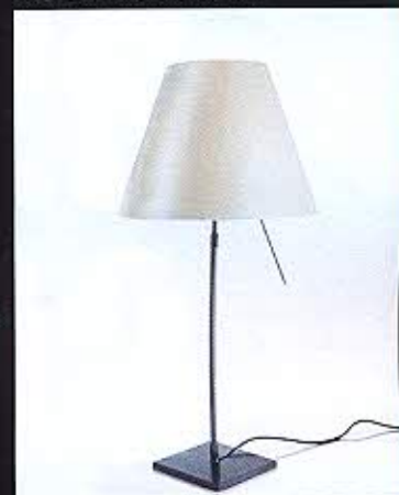
P. Rizzatto, Costanza (Luceplan, 1986)