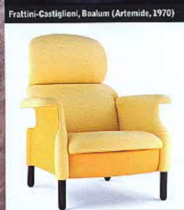
A. e P. Castiglioni, San Luca (P.Frau, 1957)