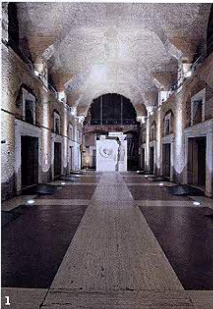
Torino, Palazzo Bertalazzone di San Fermo (2) 5-11 / 31-01- 2012