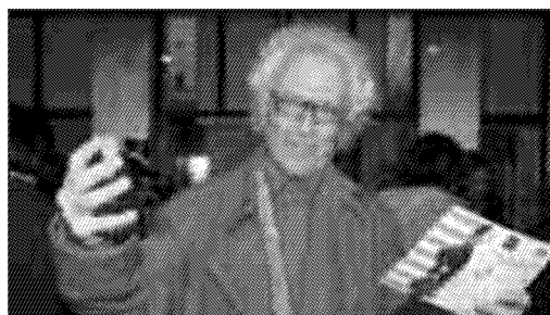
Sopra Giampiero Mughini Accanto la stilista, Delfina Delettrez